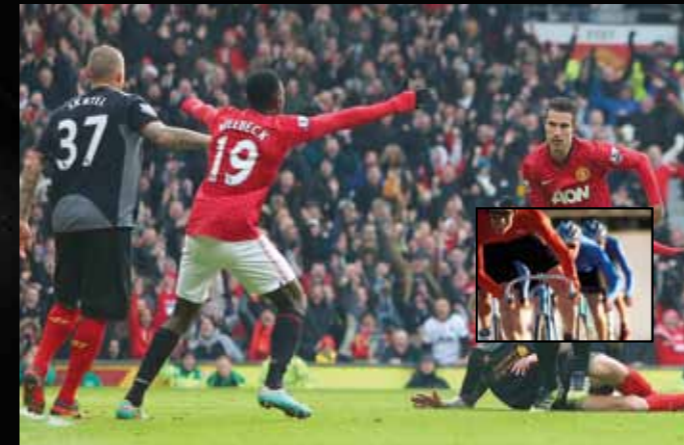
BILD IM BILD

Unsere 3D-Aktiv-Shutter-Brille mit Funktechnologie 4 ermöglicht Unterhaltung für bis zu 40 Stunden und ein schnelles Aufladen in nur drei Minuten. Tauchen Sie aus bis zu 10 m Entfernung in hochwertige 3D-Bilder ein. Die Brille ist für jeden Raum perfekt geeignet. Mit unserer innovativen Technologie zur Verbesserung der Luminanz sehen Sie störungsfreie, helle 3D-Inhalte.