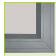
Frontansicht: nach innen abgeflachter Aluminiumrahmen