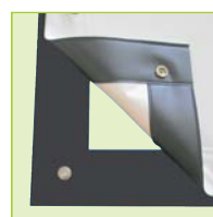
Projektionsfläche, aufgespannt mit Druckknöpfen