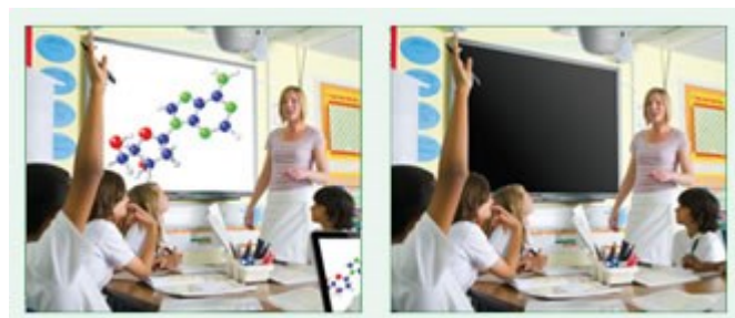
Eco AV Mute Funktion aus 100% Stromverbrauch

Behalten Sie während Ihrer Präsentation mit der ECO-AV-Mute-Funktion die Kontrolle. Richten Sie die Aufmerksamkeit Ihres Publikums durch Ausblenden weg von der Leinwand, wenn das Bild nicht benötigt wird. Dies reduziert den Stromverbrauch unmittelbar um bis zu 70%, und verlängert darüber hinaus die Lebensdauer Ihrer Lampe.