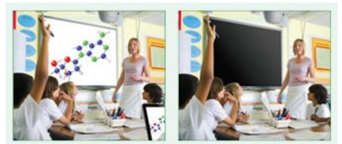
Eco AV Mute Funktion aus 100% Stromverbrauch

Behalten Sie während Ihrer Präsentation mit der ECO-AV-Mute-Funktion die Kontrolle. Richten Sie die Aufmerksamkeit Ihres Publikums durch Ausblenden weg von der Leinwand, wenn das Bild nicht benötigt wird. Dies reduziert den Stromverbrauch unmittelbar um bis zu 70%, und verlängert darüber hinaus die Lebensdauer Ihrer Lampe.